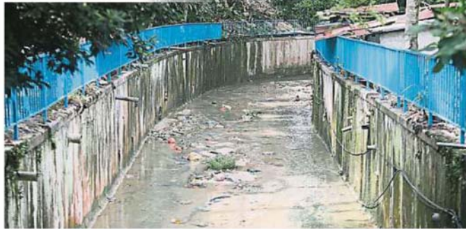
吉隆坡市政局于6月杪前来设置新围栏，解决此前栏杆毁坏不堪的问题。