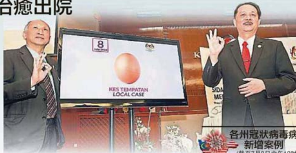
诺希山(右)表示，截至昨日中午12时新增了3宗境外输入病例，零本土感染。左为卫生部副总监(公共卫生)拿督张志强。

(布城8日讯)今日大马继续维持个位数确诊！卫生总监拿督诺希山表示，截至今日中午12时，大马新增3宗新冠确诊病例，至今累计8677宗案例。他说，我国目前还有70宗可传染他人的活跃病例。诺希山在卫生部例行冠病疫情简报会上表示，今日有5人治愈出院，累计8486人，占97.8%。他提到，今日无人死亡，维持累计121人（1.39%），目前还在加护病房的有2人，有1人需要呼吸辅助器。他补充，在今日新增的3宗病例皆是大马公民，为境外输入病例。此外，卫生部下午3时在脸书透露今日会有特别的宣布，并标注首相丹斯里慕尤丁、卫生部长拿督斯里阿汉峇峇、副卫生部长诺阿兹米和伊斯兰发展局。一些媒体因此误传首相会莅临卫生部的冠病疫情简报会现场，引起误会，事实上首相并没有现身于简报会现场。