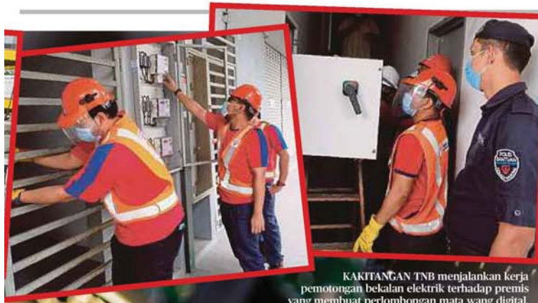
KAKITANGAN TNB menjalankan kerja pemotongan bekalan elektrik terhadap premis yang membuat perlombongan mata wang digital.

Provided for client's internal research purposes only. May not be further copied, distributed, sold or published in any form without the prior consent of the copyright owner.