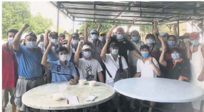
■ 皇冠城第8区早市巴刹小贩拒绝搬迁新巴刹。