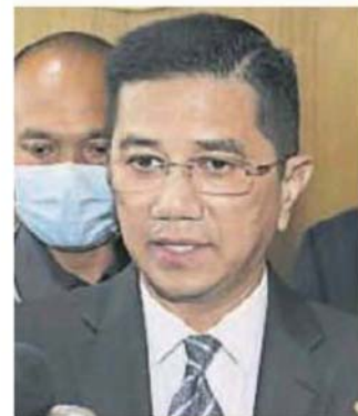
■ 受媒体访问。 阿兹敏出席活动后,接