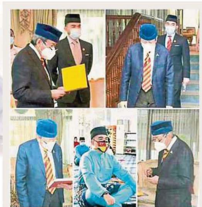
雪州苏丹沙拉弗丁与王储东姑阿米尔沙出席公共场合时，都会以身作则，遵守防疫标准作业程序。