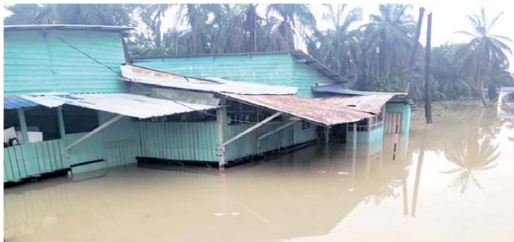
Kedudukan sebuah rumah dinaiki banjir di Kampung Seri Sentosa semalam.

KUALA SELANGOR - Seramai tujuh mangsa daripada tiga keluarga ditempatkan di Pusat Pemindahan Sementara (PPS) Dewan Majlis Daerah Kuala Selangor (MDKS) Desa Coalfield ekoran kejadian banjir di Kampung Seri Sentosa di sini kelmarin.