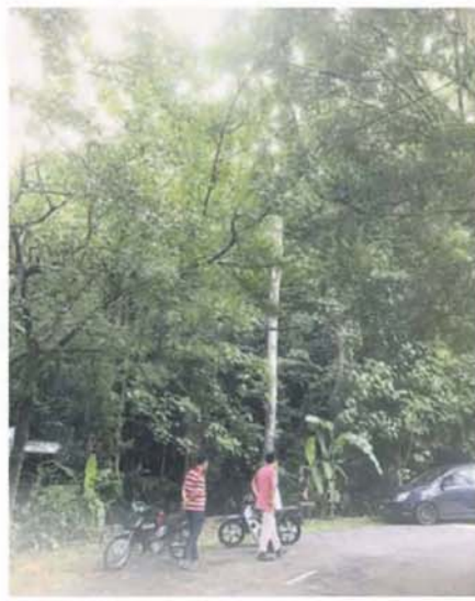
翠岭镇第7区7/68路，野树已与电缆纠缠不清。

“翠岭镇第6和第7区多个沟渠都破了，包括在翠岭镇国中的围墙倒入沟渠已多年，至今都没有人处理，希望州议员有时间下来看看。”