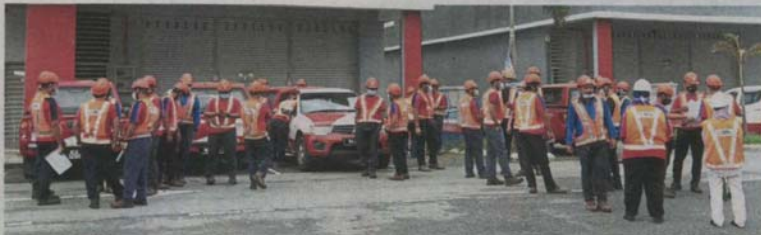
TNB, EC and MPK officers raiding two premises in Jalan Bayu Laut 15 in Taman Pendamar Indah, Port Klang for using unauthorised connections to get electricity supply during a joint operation.

"If the electricity connection is not done with the proper equipment and protection, it can result in an overload which can be a fire hazard.