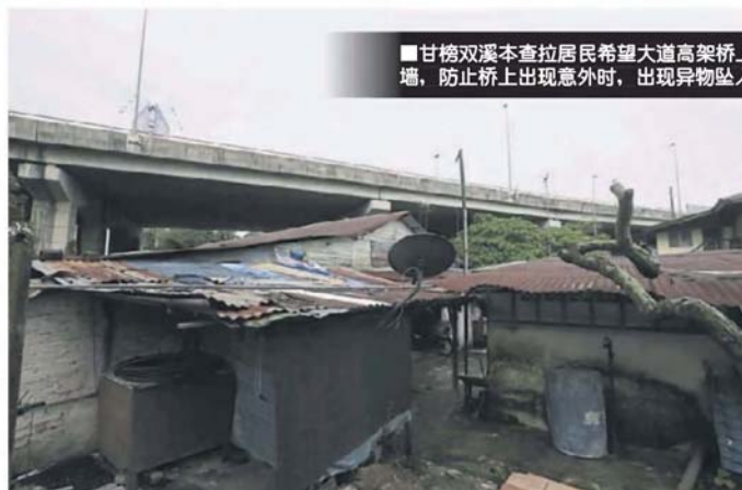
■甘榜雙溪本查拉居民希望大道高架橋上增設隔音牆，防止橋上出現意外時，出現異物墜入民居。