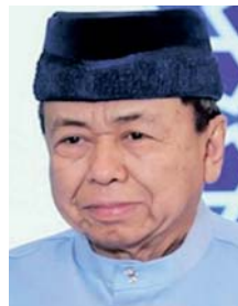
SULTAN SHARAFUDDIN IDRIS SHAH

Menerusi perhatian yang dilakukan, baginda mendapati rakyat negeri ini tidak lagi mematuhi garis panduan yang ditetapkan termasuk berada di tempat awam tanpa memakai pelitup muka serta tidak menjaga jarak sosial. Baginda bimbang sekiranya masih ramai yang berdegil dan tidak mengamalkan normal