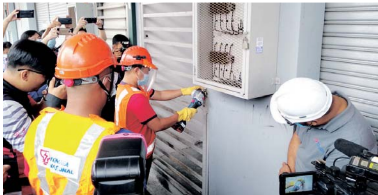
Pintu premis terpaksa dipecahkan oleh kakitangan TNB dalam operasi tersebut.

Timbalan Pengarah Penguatkuasaan Suruhanjaya Tenaga,