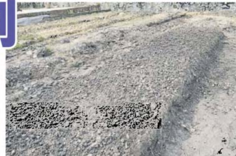
■南瓜、芫菜及番薯叶等。居民可以在肥沃的土地上，种植小白菜、菜心、