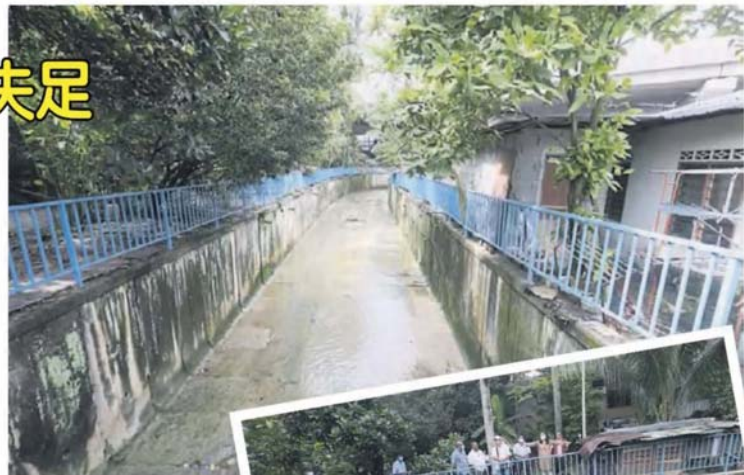
2000令吉，修复当地约300公尺的围欄。