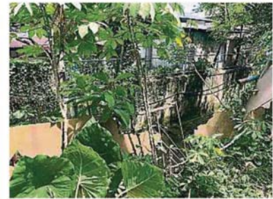
甘榜双溪本查拉居民住所的后方为双溪本查拉河，不过设置在彼处的围栏破损不堪近4年，平日也有孩童在该处嬉戏，故引起当地安全隐忧。