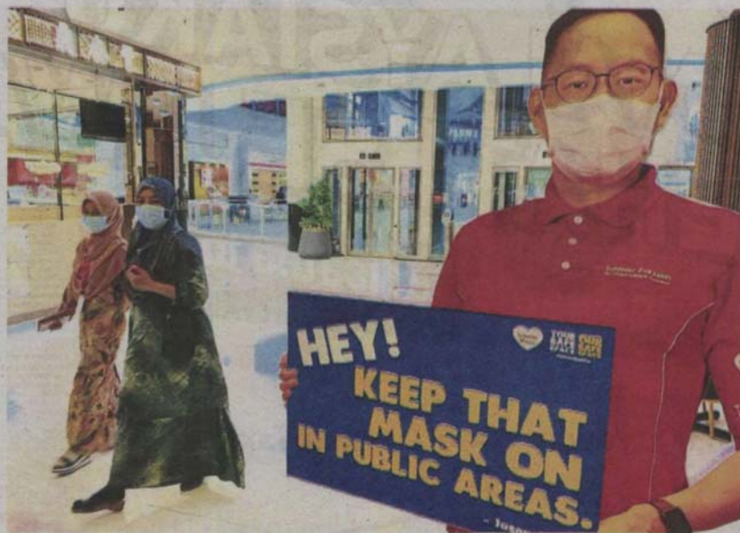
Public notice: A cutout placed at a shopping mall in Selangor.

Hence, Sultan Sharafuddin urged everyone to maintain discipline by always wearing a face mask, cleaning their hands with sanitiser or soap as well as observing social distancing of at least one metre.