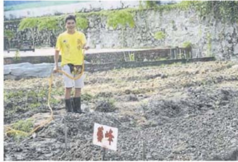
■社区菜园计划可让居民享受自给自足的樂趣。