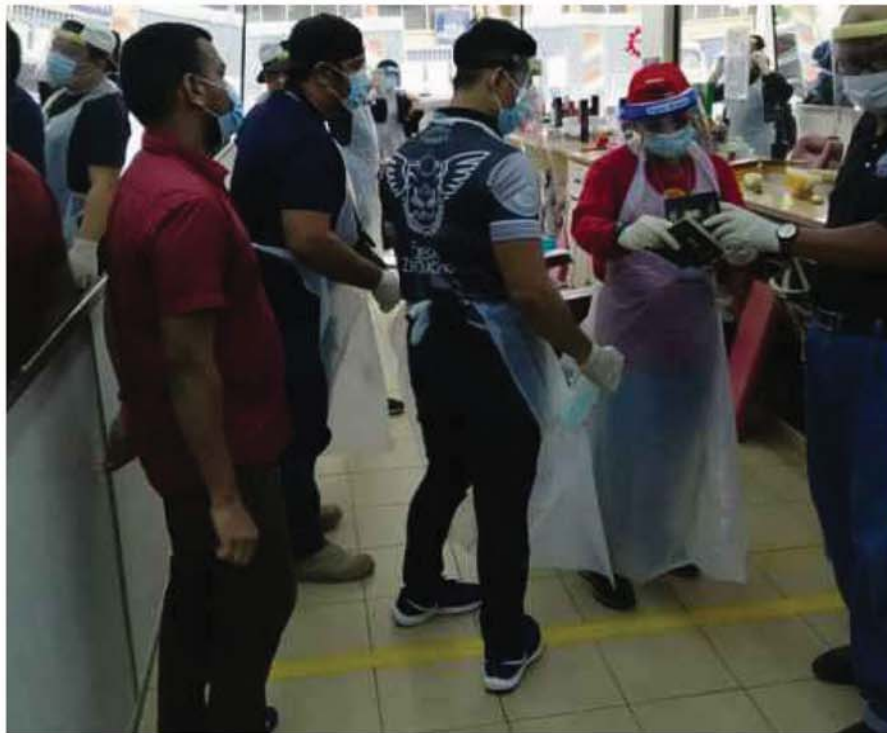
ANGGOTA penguat kuasa JIM Selangor memeriksa premis perniagaan di sekitar Banting, semalam.

Imigresen tahan enam Pati sekitar Banting