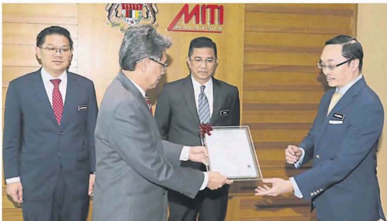
阿末法兹里（左）移交认证予诺阿兹曼。后排左起为林万锋和阿兹敏阿里。

活动出席者有贸工部副部长拿督林万锋、大马工业研究及规格公司主席和总执行长阿末法兹里和贸工部副秘书长拿督斯里诺阿兹曼。