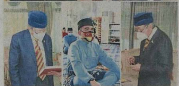
■苏丹沙拉弗丁与王储东姑阿米尔沙出席公共场合时，都会以身作则遵守SOP。